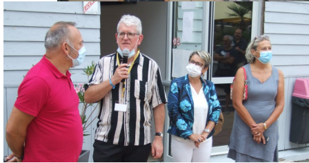
L'accueil en présence de Madame la Maire de La Tremblade.