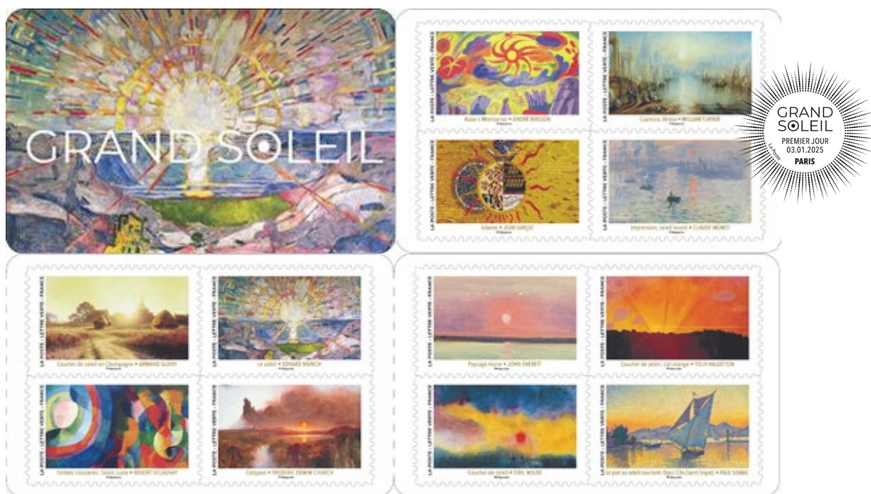
Visuels d'après maquettes - Couleurs non contractuelles/disponibles sur demande

Le 6 janvier 2025, La Poste émet un carnet de douze timbres-poste ou l'astre solaire a inspiré de nombreux artistes de toutes époques et courants artistiques.