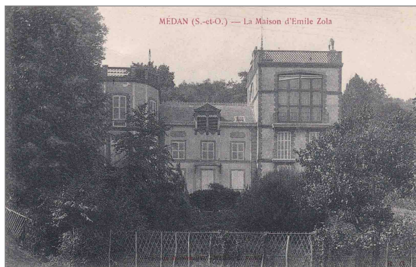
En 1878, les Zola achètent une maison à Médan grâce aux gains importants générés par la vente de L'Assommoir. Dans cette maison, un groupe d'écrivains composé de Zola, Hennique, Maupassant, Céard, Alexis et Huysmans se réunit fréquemment.

En septembre 1889, les Zola s'installent au 21 bis de la rue de Bruxelles, près de la place Clichy. C'est là qu'Émile Zola meurt le 29 septembre 1902. Sa mort est due à une intoxication à l'oxyde de carbone dégagé par un feu à boulets.