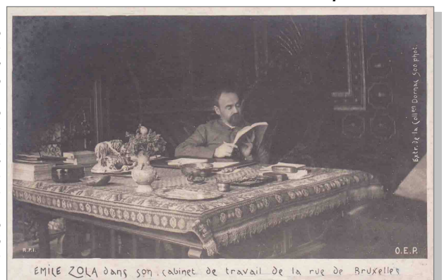
ÉMILE ZOLA dans son cabinet de travail de la rue de Bruxelles

En septembre 1889, les Zola s'installent au 21 bis de la rue de Bruxelles, près de la place Clichy. C'est là qu'Émile Zola meurt le 29 septembre 1902. Sa mort est due à une intoxication à l'oxyde de carbone dégagé par un feu à boulets.