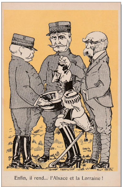
14 Caricature représentant Joffre, Foch et Clemenceau qui force Guillaume II à « rendre l'Alsace et la Lorraine ».

Il devient ainsi pour l'opinion le Père la Victoire (16). Avec l'Américain Wilson, le Britannique Lloyd George et l'Italien Orlando, il constitue le Conseil des Quatre qu'il préside. Trois axes directeurs motivent sa détermination :