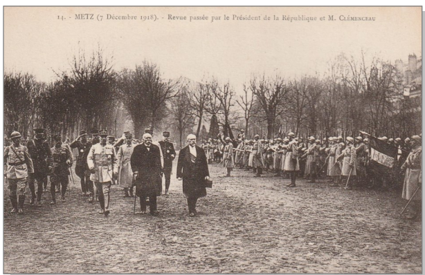
15 Très rapidement, après la signature de l'Armistice du 11 novembre 1918, Clemenceau et Poincaré entreprennent un voyage triomphal en Alsace et en Lorraine.

la réintégration de l'Alsace et de la Lorraine à la France, les réparations imposés à l'Allemagne et la sécurité de la France à sa frontière avec l'Allemagne. Le 19 février 1919, il subit de la part d'un anarchiste, Émile Cottin, une tentative d'assassinat. Cet événement accentue encore la considération des