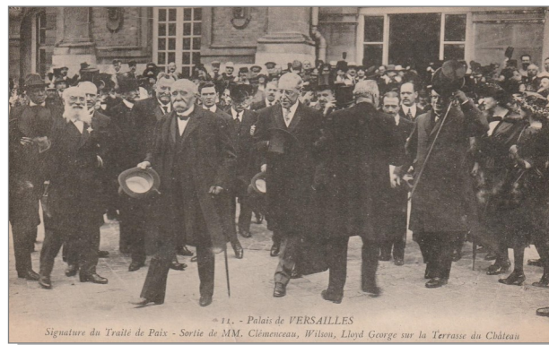
17 Le 28 juin 1919, date anniversaire de l'attentat de Sarajevo, est signé dans la galerie des Glaces du château de Versailles, le traité qui portera le nom de traité de Versailles. Il définit les conditions du traité de paix entre l'Allemagne et les Alliés. Lloyd Georges, Premier ministre britannique et Georges Clemenceau sortant de réunion.