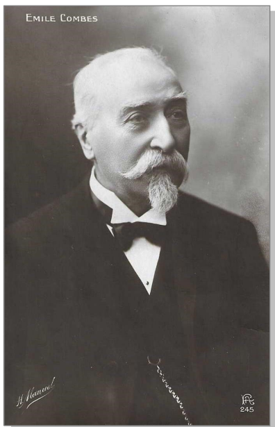
1 Émile Combes, v. 1905.

La III e République est riche en lois majeures qui régissent encore maintenant la vie politique et sociale de la France. L'une d'entre elles conduisit à la séparation de l'Église et de l'État et celui que l'on devait appeler le « Petit Père Combes » en fut l'inspirateur (1). La III e République a eu ses scandales et c'est par l'un de ceux-ci, l'Affaire des fiches, que Combes devait disparaître de la scène nationale. Il a consacré la plus grande partie de sa vie à la politique et à Pons, sa ville charentaise d'adoption.