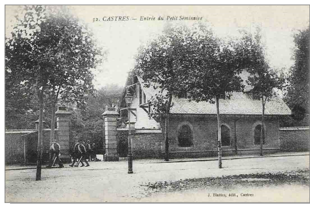
4 L'entrée du Petit séminaire de Castres où Combes commença ses études.

Émile Combes naît le 6 septembre 1835 à Roquecourbe (2), petite bourgade du Tarn, proche de Castres. Il est le 6 e de 10 enfants. Son père, tailleur, peine à faire vivre sa famille nombreuse et modeste. Il est baptisé le jour de sa naissance (3). Jean Gaubert, un cousin prend Combes sous son aile bien que celui-ci ait jugé plus tard Gaubert, « comme une ombre protectrice et pesante ».