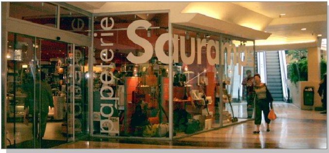
2 Autocollant en vitrophanie pour les magasins.