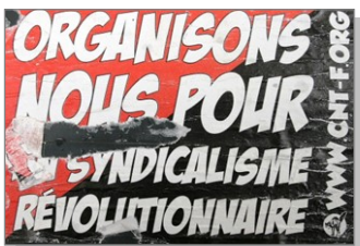
4 Sticker ou autocollant révolutionnaire.

Les stickers militants ou politiques : ils revendiquent une position ou un message. Ils représentent une contre-culture et ont tendance à être collés sur les autres publicités qu'ils dénoncent. Ils se présentent ainsi comme une façon