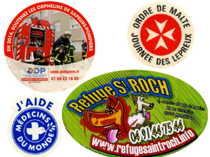
7 Stickers ou autocollants publicitaires.

Les stickers publicitaires : ils servent à faire apparaître des marques, des logos, des slogans publicitaires (7). La plupart sont produits en masse par les annonceurs et les partis politiques, mais certains sont produits en petites séries comme les autocollants de groupes de musique pour véhiculer leur nom ou leur association.