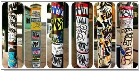
3 Tags sur stickers ou autocollants collés sur des colonnes.

Les stickers artistiques ou tags : il s'agit souvent, à partir d'un autocollant vierge, de faire une petite œuvre d'art, allant du tag (3) au dessin. On voit de plus en plus se développer des stickers artistiques en vinyle, sur lesquels un travail graphique est effectué avant de les imprimer en série.