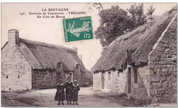
1 Bourg de Trégunc.

Le bourg (1), situé à l'intérieur des terres, occupe une position excentrée à distance de la côte, sur le plateau. On y remarque en premier l'église