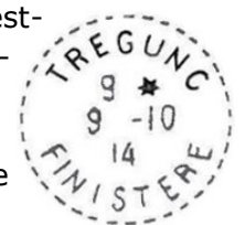
3 Timbre à date type B4 (nomenclature Lauthier) de 1914.

Le premier bureau de poste de Trégunc s'est ouvert le 1 er juillet 1906 rue Saint Philibert. C'est en fait une recette-distribution, c'est-à-dire un établissement sans comptabilité propre, avec un facteur-receveur. Le timbre à date est un timbre à un seul cercle formé de tirets, avec un bloc dateur sur trois lignes indiquant l'heure, le quantième, le mois, et le millésime à deux chiffres (type B4) (3).