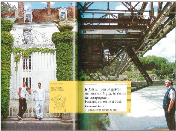
③ & ④ Le livre « Facteurs en France » et la première page de l'article consacré à Emmanuel

du Mée-sur-Seine qui est intervenu à temps en entendant les gémissements d'une vieille dame tombée en taillant ses rosiers depuis plusieurs heures, incapable de bouger... au point d'être devenu ensuite son sauveur. »