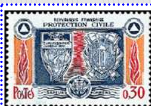
← Timbre de 1964

Cette fois c'est 10 timbres qui, d'un coup, rendent hommage aux pompiers à travers toutes leurs actions de sauvetage et leur protection vestimentaire (notamment le fameux casque de pompier). C'est PHILAPOSTEL, ton association, qui organisera dans 10 villes le premier jour de ce bloc.