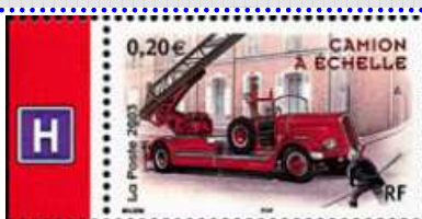
Un des 2 timbres du bloc de 2003 →