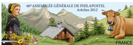
La vignette LISA "60ème assemblée générale de PHILAPOSTEL Arêches 2012"

Ce retable avait déjà fait l'objet d'un timbre émis en 1985 au profit de la Croix-Rouge. C'était un timbre plus traditionnel qui reproduisait une partie de la peinture : l'ange joueur de viole de gambe..