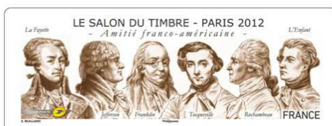
La vignette LISA du Salon du timbre - Paris 2012 "Amitié franco- américaine"