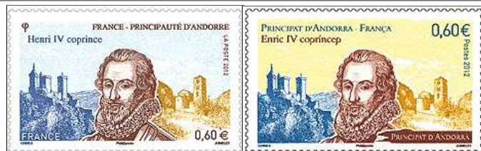
Les deux faux-jumeaux : Henri IV coprince d'Andorre

** La maximaphilie est la collection des cartes postales revêtues côté vue d'un timbre et d'un cachet d'oblitération, les trois ayant tous trait au même sujet.