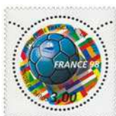
1998 : 1 er timbre rond français