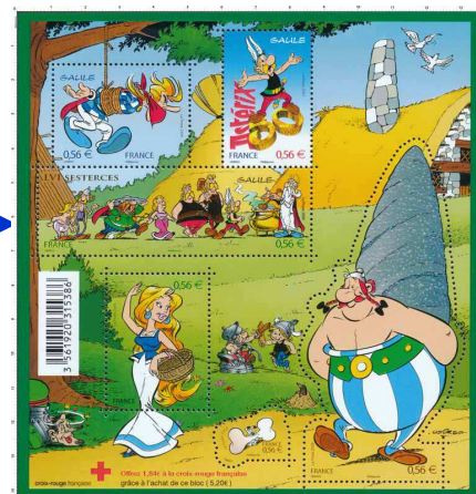
Bloc de 6 timbres dont 1 au format du personnage représenté : Obélix