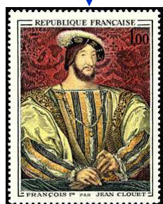
Timbres de la série artistique au format tableau

de collectionner les timbres oblitérés. En effet il y a des timbres qui sont très difficiles à trouver sur du courrier aujourd'hui, et c'est tout un plaisir de la collection que de les rechercher. Conserve-les ainsi, et qui sait, ils prendront peut-être un jour de la valeur !