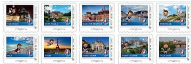
Les timbres sur les villes de l'Euro

Le timbre est émis en taille-douce et a été gravé par Elsa Catelin, l'une des deux artistes qui à La Poste gravent les timbres (l'autre est Pierre Bara, c'est bien sûr un garçon !).