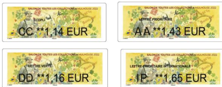
Création de Geneviève Marot

Parc des Expositions de Mulhouse - 120 rue Lefebvre – MULHOUSE