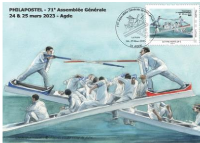
Carte postale n° 1