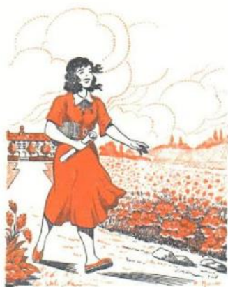
ORPHELINS DES P. T. T. CREATION DU FOYER FEMININ

La série de 2 cartes postales en fac-similé de l'exposition qui s'est tenue du 29 novembre au 2 décembre 1956 au Ministère des PTT : 2 €